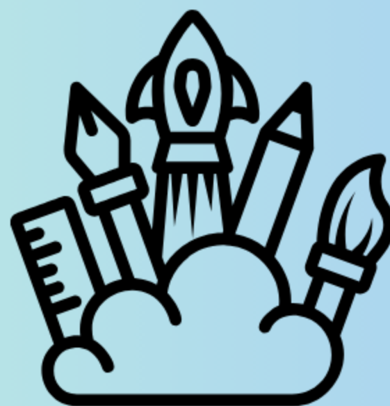
Atelier Créatif Scrapbooking