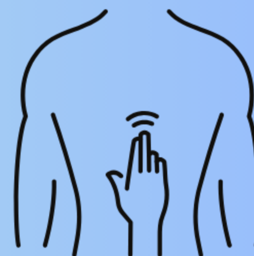
Shiatsu - Do-in