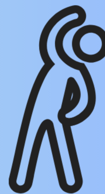
ACTIVITÉ PHYSIQUE ADAPTÉE